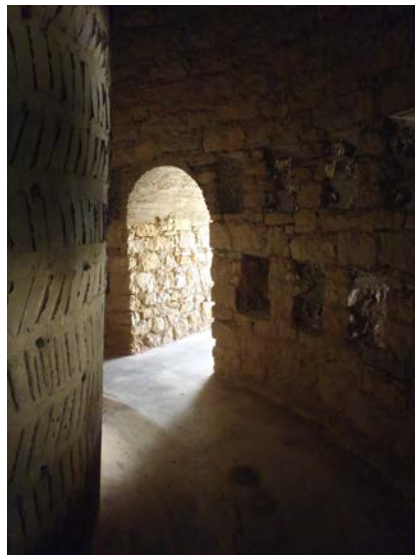
Photographie 4 : La paroi du puits aérien de Knapen est ventilée mais elle est épaisse de plus de deux mètres et le rayonnement solaire ne pénètre pratiquement pas la structure, ce qui était censé garantir au système une stabilité thermique suffisante.

un autre Chaptal qui est resté à l'eau) en construit un plus petit sur le même principe, une pyramide de pierres de 3 m de haut qui, au cours de l'été 1930, aurait produit 88 litres d'eau. Dans la foulée, l'année suivante, un belge, Achille Knapen, bâtit à Trans-en-Provence (Var) un prototype de « puits aérien » plus élaboré, une sorte de tour ventilée de 12 m de diamètre sur 13 de haut qui existe toujours (photographies 3, 4 et 5). Au final, comme la condensation est provoquée par un gros changement de température de l'air, l'élégant « proto » de Knappen, trop ventilé et qui manque d'inertie thermique, dont du coup la température intérieure reste influencée par l'extérieur, marche moins bien que celui de Zibold pourtant hyper-basique : juste un gros tas de cailloux avec de l'air qui passe dedans. Oui, c'est ça : exactement comme un bon vieux massif karstifié !