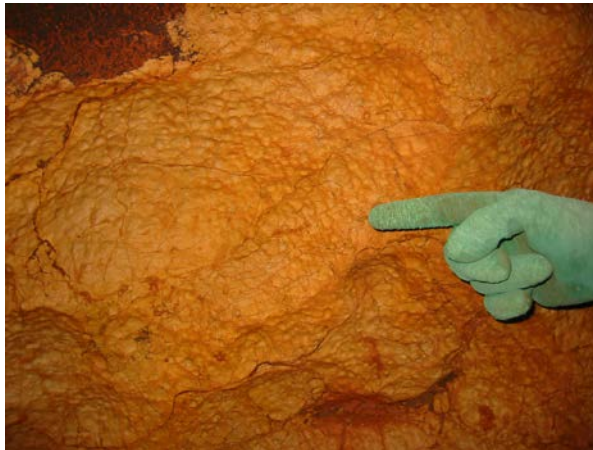
Photographie 6 : Portion de plafond où le calcaire encaissant a été corrodé par des gouttelettes de condensation, formant ainsi des micro-cupules, un exemple dans la grotte du Revest, Alpes-Maritimes.

Si l'eau de pluie est capable de se combiner avec du gaz carbonique et de bouffer le calcaire, cette eau condensée à l'intérieur du karst joue forcément elle aussi un rôle dans la spéléogénèse : vu que la circulation d'air y assure un apport permanent de CO 2 , pourquoi diantre ce film d'eau de condensation ne serait pas lui aussi capable de s'acidifier ? Du coup, comme la rouille qui rongerait les grilles oubliées dans les prisons s'il n'y venait personne et qui, en tout cas, attaque bel et bien la ferraille des vieux maillons rapides laissés en fixe (ah, ça, sous terre, vous l'avez vu aussi bien que moi, hein ?), ce « film acide » sur la paroi corrode le carbonate (photographie 6). Puis, comme la circulation d'air assure AUCSI un apport constant en humidité, le film d'eau, constamment alimenté par la condensation, s'égoutte ou flue lentement vers le bas des parois en entraînant le carbonate en solution et finit par s'évacuer par ruissellement et infiltration, en exportant donc de la matière. D'où, donc, bouffage de paroi et agrandissement de trou. Spéléogénèse, quoi.