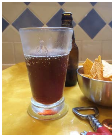
Photographie 1 : L'humidité de l'air se condense spontanément sur une paroi froide. Et il faut reconnaître que plus il fait chaud et meilleur c'est. Purée, qu'est-ce que j'aime la science, moi...

Des ingénieurs ont cherché depuis des lustres à capter cette eau masquée, ressource précieuse dans les zones arides ; beaucoup de systèmes de collecte de l'eau atmosphérique par condensation naturelle, sans ventilation forcée et sans aucune source de froid technique, ont été essayés. En 1905, le russe Friedrich Zibold édifie à Théodosia (Ukraine) un gros condenseur atmosphérique en pierres de 20 m de diamètre et de 6 m de haut, qui aurait produit jusqu'à 360 litres d'eau par jour ! En 1929, à Montpellier, Léon Chaptal (pas le Chaptal qui a inventé de mettre du sucre dans le jus de raisin pour alcooliser le pinard,