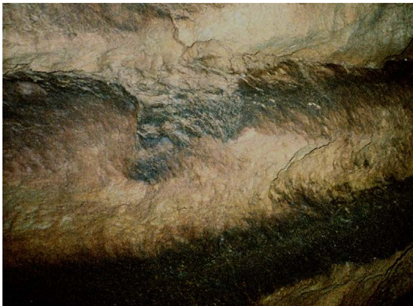
Photographie 11 : Spéléosols sur la face supérieure de banquettes paragenétiques (voir Spelunca n°133), communs dans les grottes fossiles (ici, grotte des Garamagnes à Callian, Var). Ceux-là sont épais, colorés, bien visibles, mais les bactéries c'est pas toujours aussi tape-à-l'œil.