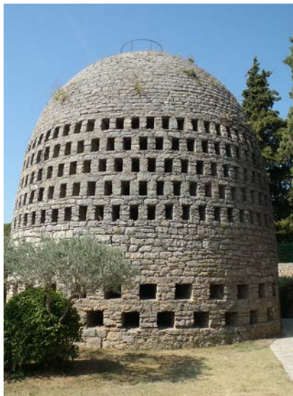
Photographie 3 : Le puits aérien d'Émile Knapen (Trans-en-Provence, Var).