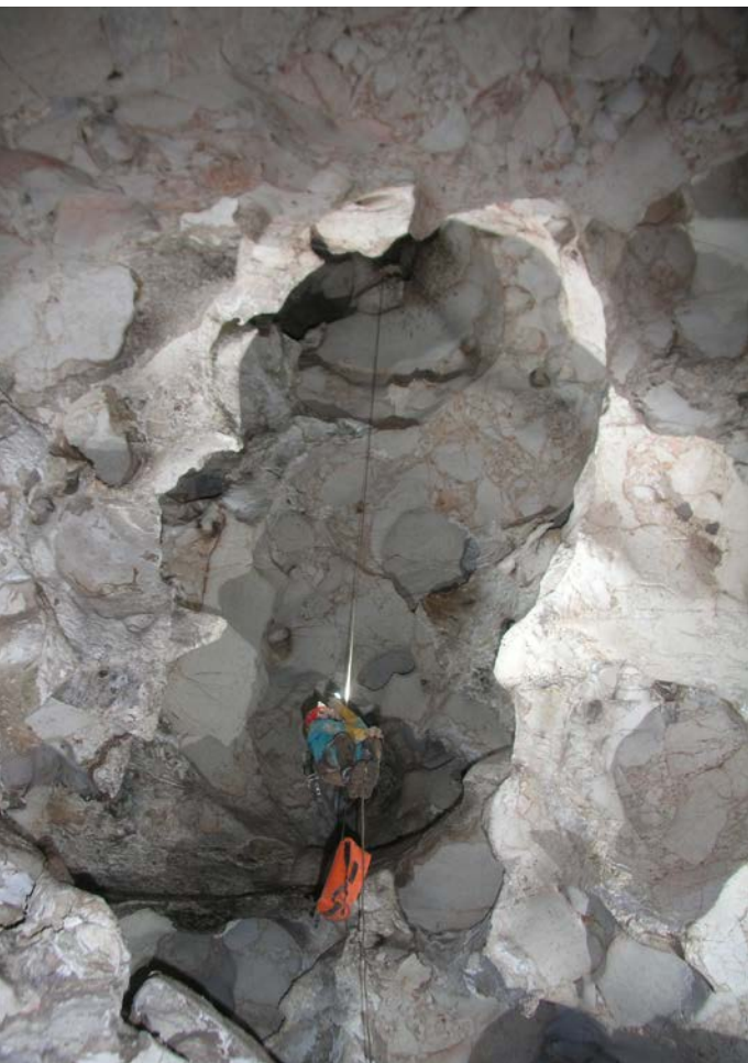
Photographie 13: Ce puits de l'Abisso dell'Eremita (Province de Trapani, Sicile) ne présente aucune forme (cannelure, incision, méandre) liée au creusement par un écoulement d'eau comme dans le karst « classique ». Il a en fait été élargi à partir d'un petit conduit initial par la condensation-corrosion: les volutes d'air chaud et humide ont creusé de larges coupoles d'orientation aléatoire, qui ont corrodé uniformément et sans différenciation tous les éléments d'un encaissant pourtant très hétérogène (c'est une brèche, et c'est joli).