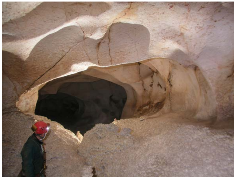
Photographie 14: Cette galerie de l'Abisso dei Cocci (Province de Trapani, Sicile) n'est qu'une coalescence de très grandes coupoles, creusées à partir d'un conduit phréatique initial de petites dimensions par des convections d'air chaud et humide montant du fond.