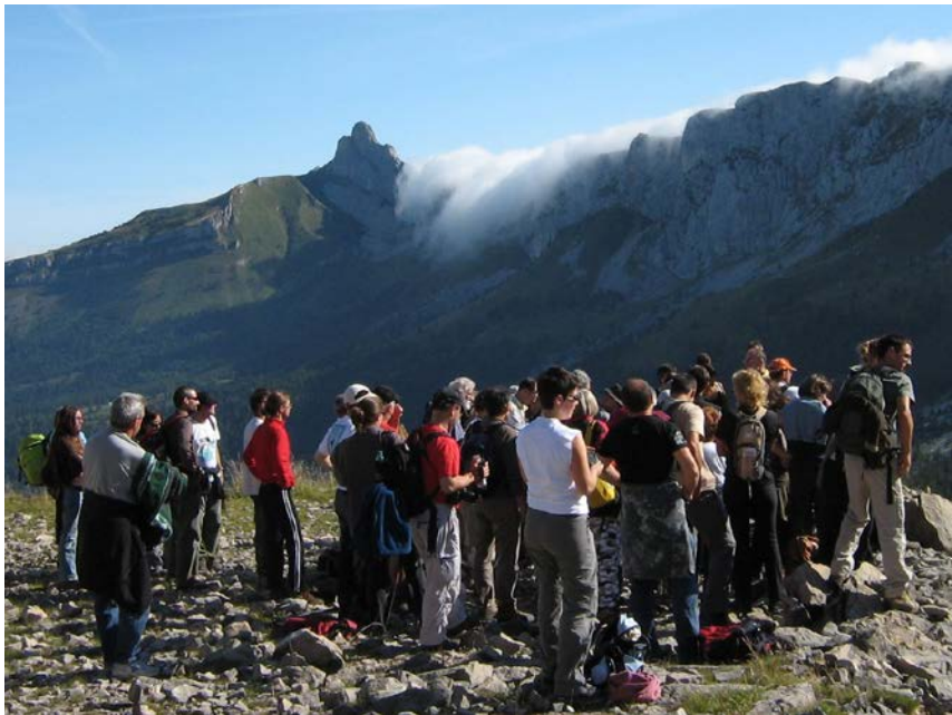
Photographie 2 : Nuée débordant une crête, puis disparaissant immédiatement. Ce phénomène fréquent en montagne permet de «voir» le point de rosée : côté adret, le vent fait monter l'air de la vallée le long du versant ; en prenant de l'altitude, l'air se refroidit (en gros 1°C tous les 150 m), le point de rosée est franchi et l'humidité se condense en nuage ; l'air (donc le nuage) passe la crête, redescend et se réchauffe, le point de rosée est franchi dans l'autre sens et la vapeur disparaît. L'humidité ne varie pas, mais tantôt sous forme de brouillard et tantôt sous forme gazeuse, tu me vois, tu me vois plus. C'est aussi comme ça que se produit l'« effet de Foehn ».