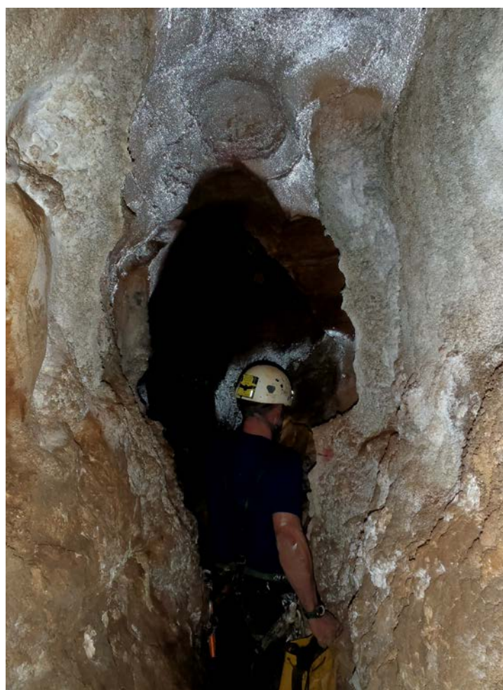
Photographie 15: Grotte della Cucchiara (Monte Kronio) ; ce sont les gouttelettes d'eau qui donnent cet aspect argenté à la voûte, où l'air qui remonte du fond du réseau à plus de 35 ° C et saturé d'humidité dépose constamment de la condensation. Elle corrode le calcaire et ruisselle sur les parois ; les altérites entraînées par le ruissellement s'accumulent en croûtes au bas des parois, où l'air sec et frais venu de l'extérieur a tendance à assécher le film humide. On peut voir à la voûte une coupole en formation (pas facile de faire des photographies dans ces conditions, les appareils photographiques sont pleins de buée parce qu'ils ont du mal à s'équilibrer avec la température du lieu. Le photographe aussi...).