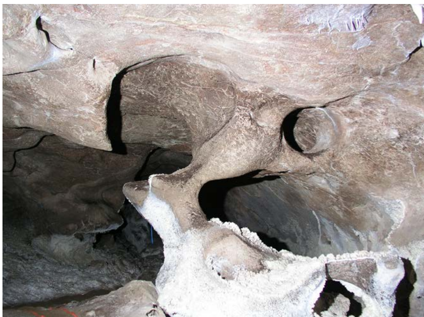
Photographie 12 : Une des innombrables morphologies pseudo-phréatiques dans Lechuguilla. On dirait tout à fait des formes noyées, mais ça fait six millions d'années que la tranche où se développe la grotte est en zone aérée ; en fait, les boyaux d'origine ont été élargis par les circulations d'air sulfureux chargeant d'acide sulfurique les films de condensation, de sorte qu'ils se sont élargis dans toutes les directions, exactement comme une vraie galerie en « conduite forcée ». On distingue au bas des parois des croûtes de gypse, produit par la corrosion sulfurique du calcaire et entraîné par les condensats. À un ion près, c'est le même processus dans la condensation-corrosion carbonique.

convectent tout le temps, à la longue ça creuse pile poil là, dans la paroi ou sur les plafonds, un « moulage en creux » des volutes d'air en forme de grandes coupoles, mais du coup bizarrement orientées dans un peu n'importe quel sens. Ces coupoles anarchiques font d'ailleurs de très bons indices du processus (photographies 13 et 14).